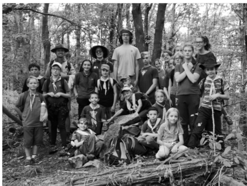
YMCA skauti z Brniště